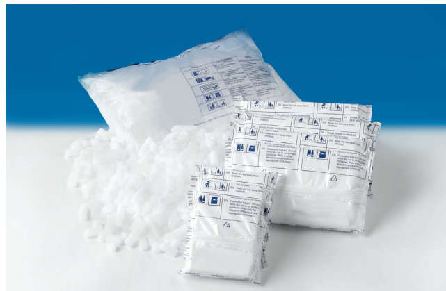
Sanlce® tørris skiver