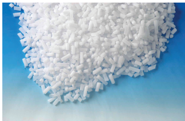
Sanlce® tørris pellets 10 mm