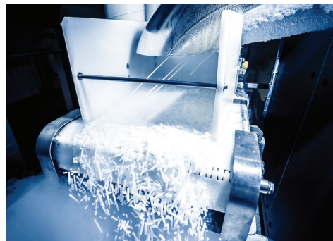
Tørrisproduksjon på eget anlegg