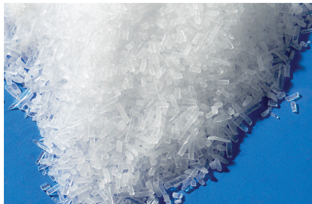
Sanlce® tørris pellets 3 mm